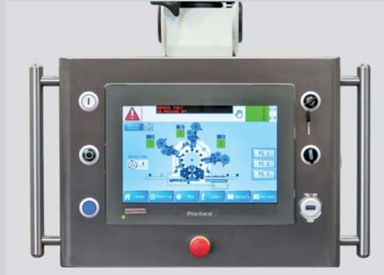
Pannello touchscreen su braccio pivotante Touchscreen panel on pivoting arm Pupitre tactile sur bras pivotant Panel touchscreen con braccio pivot Touchscreen-Bedienfeld auf schwenkbarem Arm

Orientamento ottico Optical orientation Repérage optique Dispositivo de orientación óptica Optische Ausrichtung