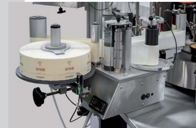
Gruppo di etichettaggio RPS RPS labelling unit Groupe d'étiquetage RPS